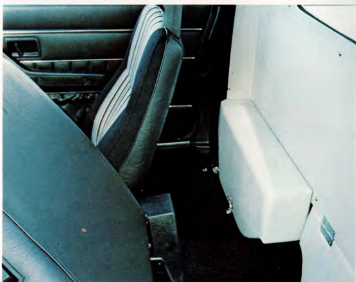
De fällbara ryggstöden gör det lättare att komma åt extrautrymmet bakom stolarna.