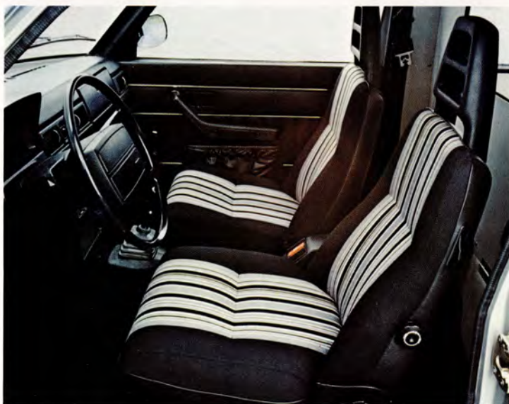
Förarstol och passagerarstol har fällbara ryggstöd.