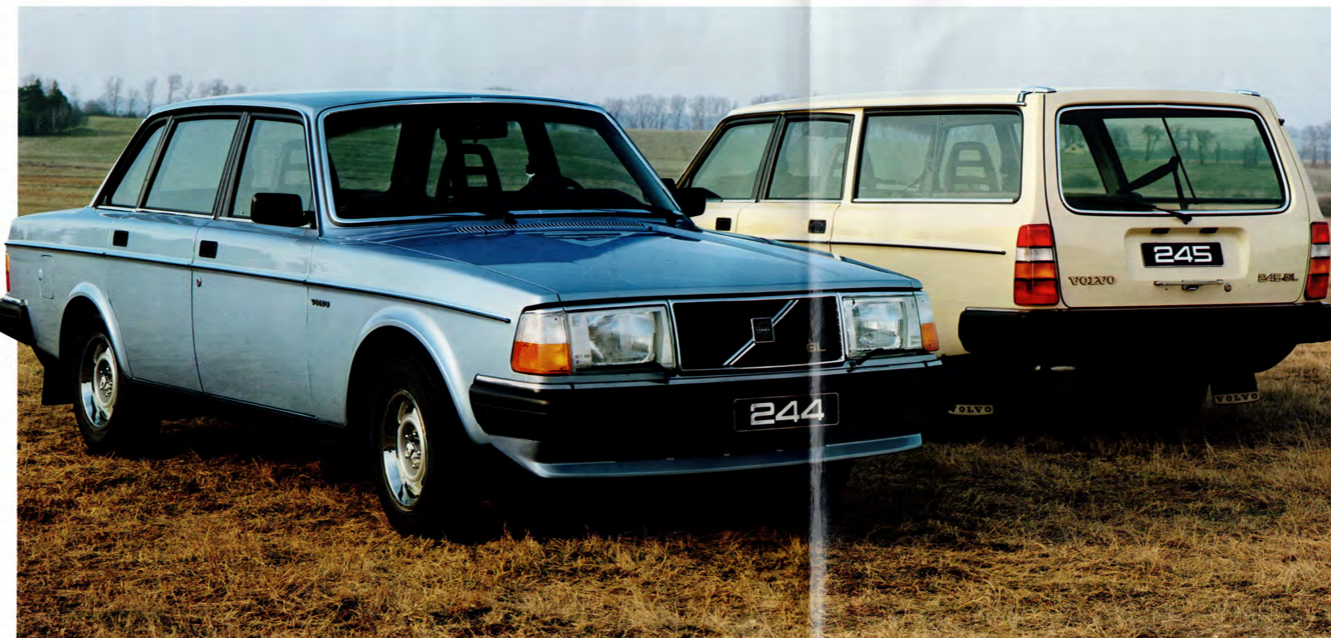
Volvo 244 GL, Volvo 245 GL.