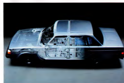
Säkerhetsbur och stötupptagande deformationszon.

Många undersökningar tyder också på att en Volvo 240 håller längre än andra bilar. Svensk Bilprovning senaste statistik t.ex. visar att Volvo som vanligt har den överlägset bästa s.k. medianlivslängden – hela 19,3 år!