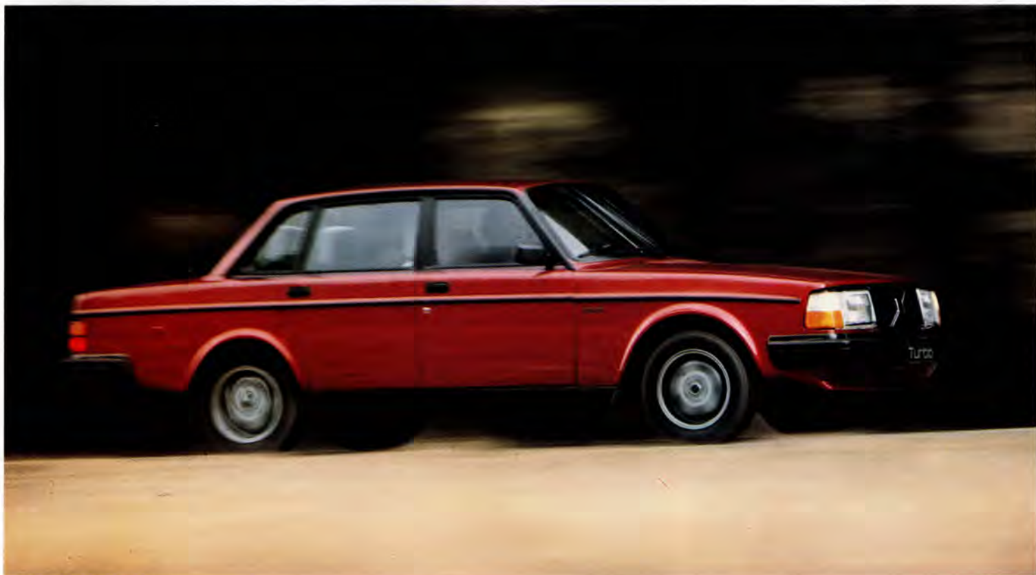
Kraftpaketet Volvo Turbo.

Volvo 245 finns i modellerna DL, GL, GLT och som diesel.