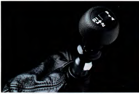
Smidig, självurkopplande överväxel.