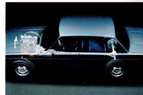
Volvos bak- och framaxelkonstruktion ger maximal väghkontakt.

Bakom ratten upplever du verkligen hur fint varje detalj i Volvos konstruktion samverkar: den utmärkta viktfordelningen, de kraftiga krängningshämarna, framvagnsupphängningen av fjäderbenstyp, den odelade bakaxeln och den lätta och precisa kuggstångstyrningen.