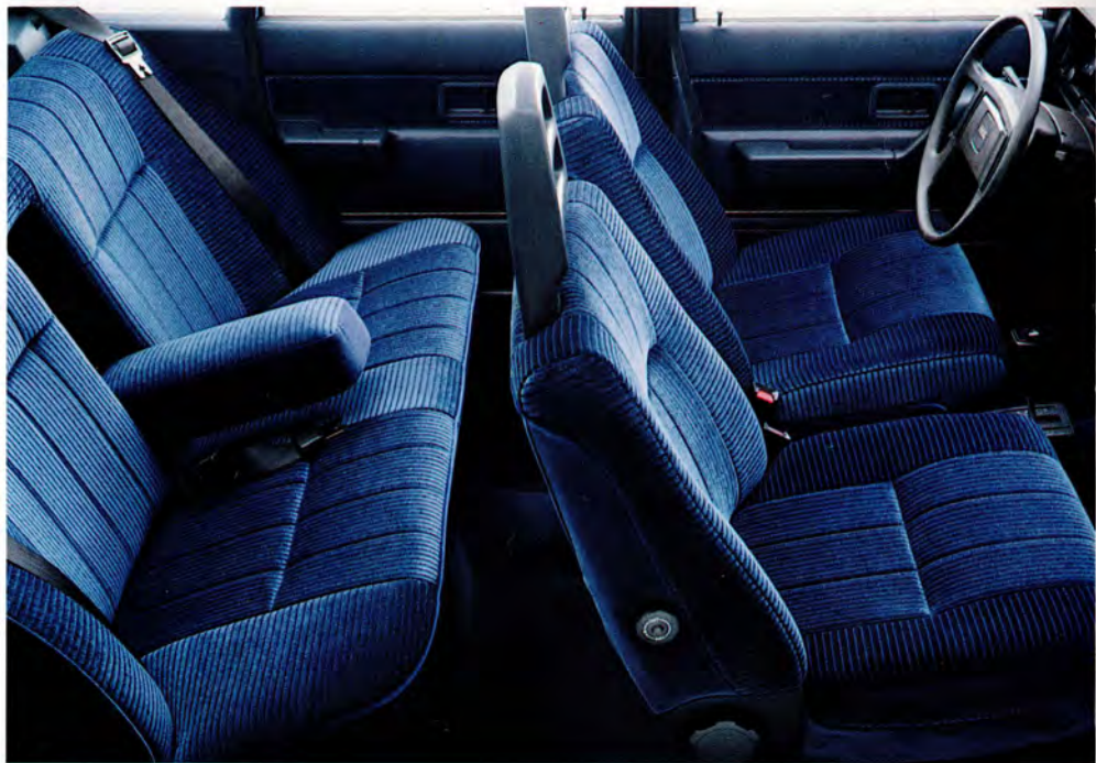
Lika bekväm timme efter timme.