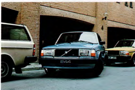
Suverän vänddiameter - 9,8 m.