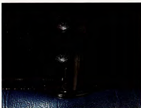
1. Centrallås är standard. Du låser eller låser upp samtliga dörrar med en enda nyckelvridning. Bekvämt och tryggt.