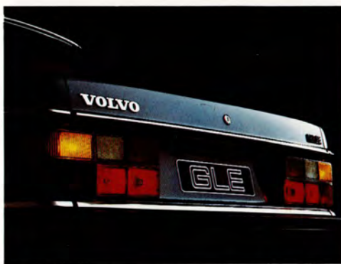
2. Bakljusen är lika eleganta som effektiva.