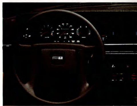
3. Den genomtänkta instrumentbrädan har en rad varnings- och påminnelse signaler för din information. Färganpassad instrumentbräda kan fås som alternativ.