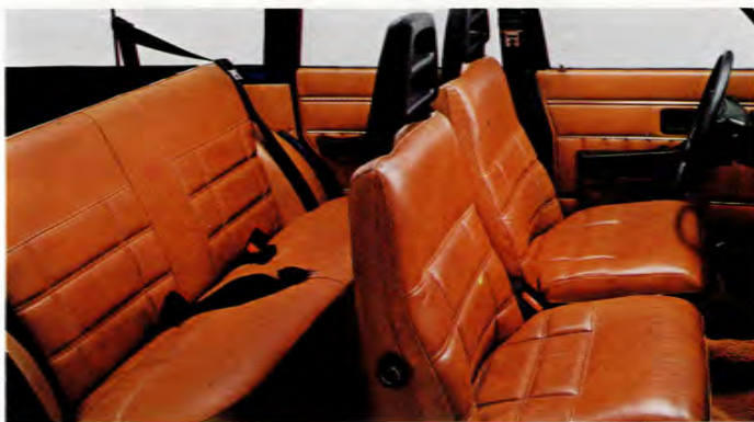
I Volvo 265 GL sitter ni på äkta läder. Gott om plats för 5 personer och ändå 1200 dm 3 lastutrymme.