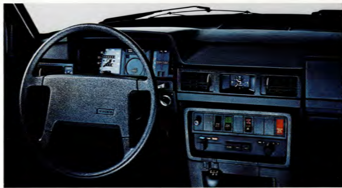
Instrumentpanelen har ett väl genomtänkt system av varnings- och påminnelse signaler.