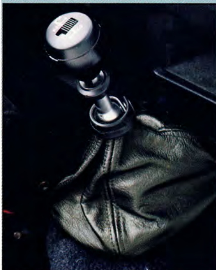
Kort, tuff och sportig växelspak med läderdamask. Manuell växellåda med överväxel.