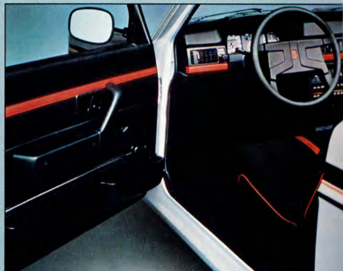
De breda dörrarna erbjuder ett bekvämt insteg. Den genomgående röda dekorlinjen återkommer på dörrpanelerna. Svarta yttre backspeglar.