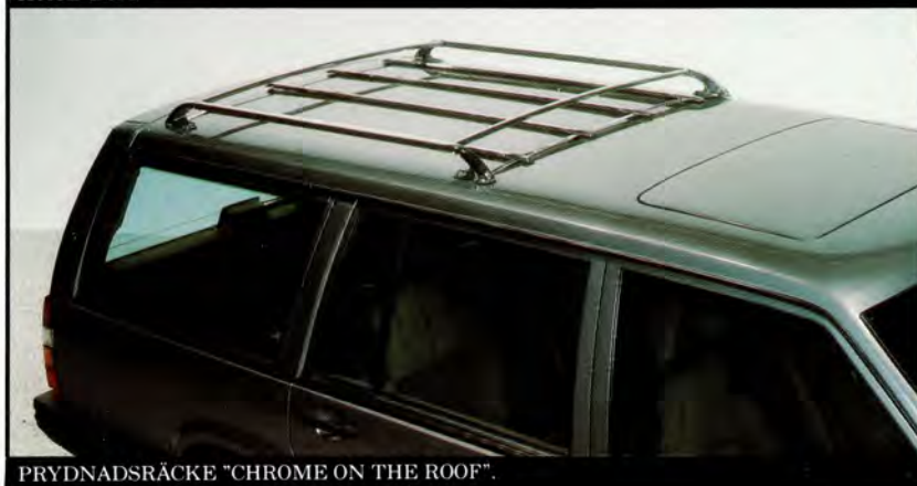
PRYDNADSRÄCKE "CHROME ON THE ROOF".