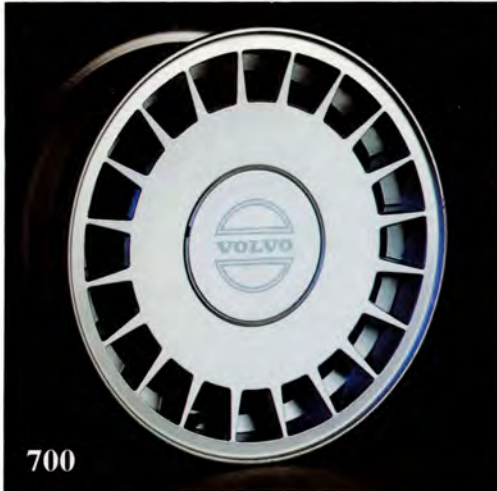
Dakota. 6×15". (1359 180) Standardfälg för 760 –88, passar 700 88–. Vikt 8 kg. Fälgkapsel (1358 923) säljs separat, standard hjulmuttrar används. Rekommenderad däckdimension 195/60×15 alt 185/65×15.