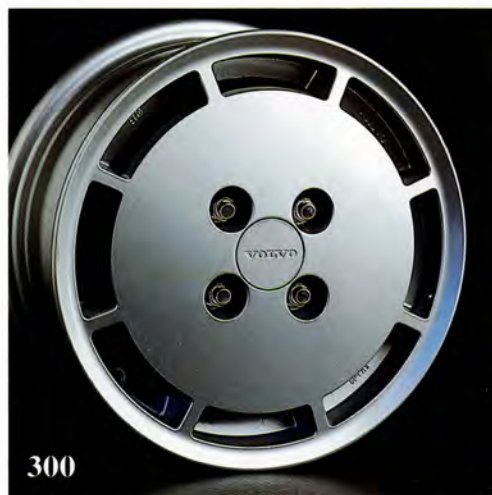
Nevada. 5,5×13". (Ljusgrå 3340 246, mörkgrå 3340 158) Passar 300-serien. Navkåpa ingår. Alternativt kromade hjulmuttrar (284 696). Rekommenderad däckdimension 185/70×13.