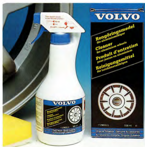
Rengöringsmedel. Var rädd om dina lättmetallfälgar och använd Volvos rengöringsmedel.

Medel för lätt smutsade fälgar. 500 ml sprayflaska och svamp (1129 655-5).