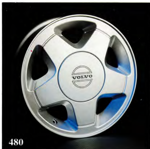
Florida. 5,5×14". (3435 991) Passar 480ES. Vikt 7,1 kg. Navkapsel (3416 507) tillkommer. Rekommenderad däckdimension 185/60×14.