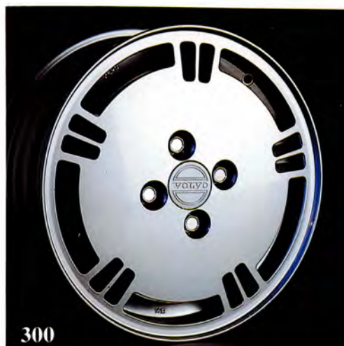
Arkansas. 5,5×14". (Ljusgrå 3340 245, mörkgrå 3340 159) Passar 300-serien. Navkåpa ingår. Alternativt kromade hjulmuttrar (284 696) tillkommer. Rekommenderad däckdimension 185/60×14.