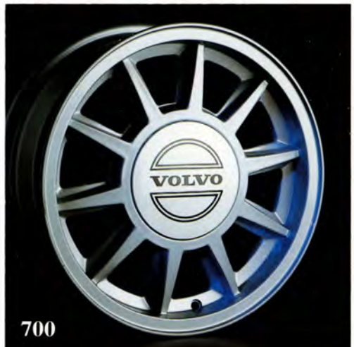
Indiana. 6×15". (1329 603) Passar 700 från –82. Vikt 7 kg. Fälgkapsel (1325 475) säljs separat, standard hjulmuttrar används. Rekommenderad däckdimension 195/60×15 alt 185/65×15.