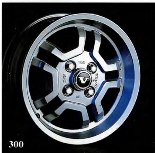
Oregon. 5,5×14". (284 600) Passar 300-serien. Navkåpa ingår. Alternativt kromade hjulmuttrar (284 696) tillkommer. Rekommenderad däckdimension 185/60×14.