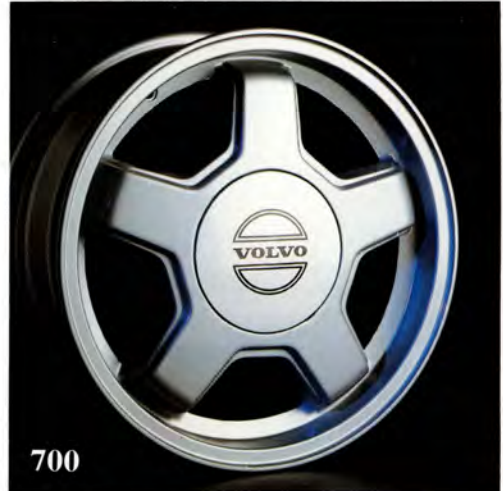
Montana. 6×15". (1330 400) Standardfälg för 740 Turbo. Vikt 6,7 kg. Fälgkapsel (1343 663) säljs separat, standard hjulmuttrar används. Rekommenderad däckdimension 195/60×15 alt 185/65×15.