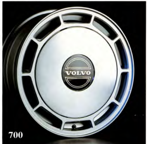
Kansas. 6×15". (1387 158) Passar 700 från –82. Vikt 7 kg. Fälgkapsel (1325 911) säljs separat, standard hjulmuttrar används. Rekommenderad däckdimension ex 195/60×15 alt 185/65×15.