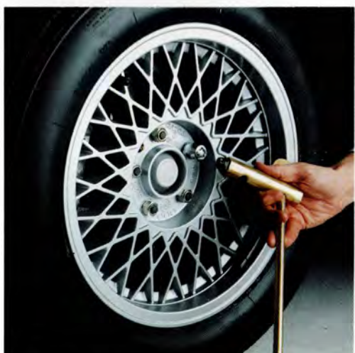
Låsbara hjulmuttrar. Volvo lättmetallfälgar är begärliga. Bästa sättet att behålla dem "på plats" är att använda låsbara hjulmuttrar. Förändrar inte hjulbalansen. Levereras i sats för fyra hjul och med två specialnycklar. Till 200-serien: 1333 684, 700-serien: 1188 841, 700-serien 88: 1387 160 (avsedd för Dakota), 300-serien 76: 3340 222.