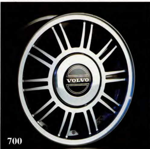
Arizona. 5,5×14". (1330 475) Passar 740 från –84 med 14" bromsar. Vikt 6,5 kg. Fälgkapsel (1272 666) säljs separat, standard hjulmuttrar används. Rekommenderad däckdimension 185/70×14.