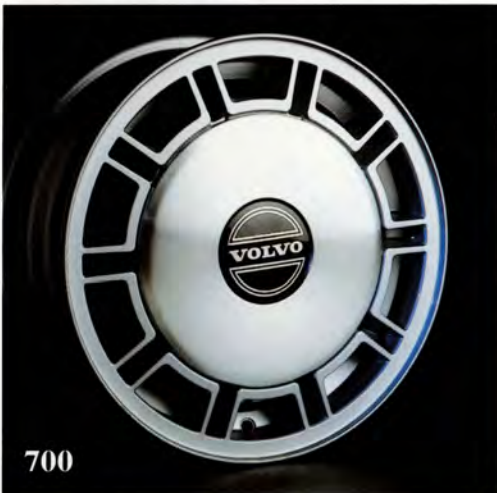
California. 5,5×14". (1387 159) Passar 740 från –84 med 14" bromsar. Vikt 6,5 kg. Fälgkapsel (1325 908) säljs separat, standard hjulmuttrar används. Rekommenderad däckdimension 185/70×14.