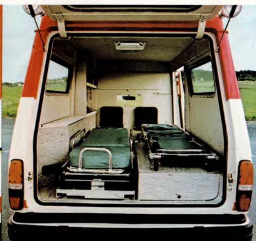
Det är gott om utrymme för vårdpersonalen, som dessutom har sjukvårdsutrustningen lätt åtkomlig.