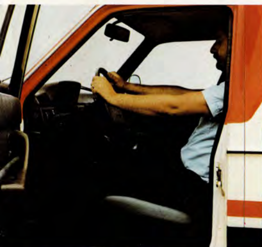
Förarutrymmet är väl tilltaget med gott om plats för benen. Volvostolen ger en bekväm, individuellt anpassad körställning.

Konstruktionen ger också miljömässiga fördelar. Vid hög yttertemperatur är det lätt att hålla klimatet i vårdutrymmet på en behaglig nivå, vintertid blir värmeförlusten mindre. Dessutom reduceras trafikbuller och onödig insyn.