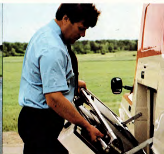
På vänster sida finns ett utfällbart fack för reservbår och verktygsutrustning – båda mycket lätt åtkomliga.