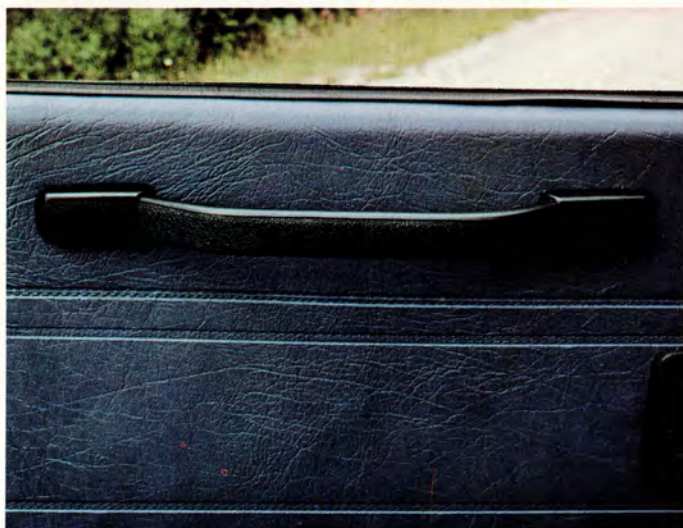
Bakdörrarna har rejäla handtag för att underlätta in- och urstigning. Dessutom har dörrarna skyddande sparkplåtar nedtill.