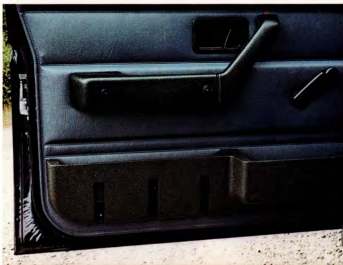
Båda framdörrarna är försedda med rymliga förvaringsfack.