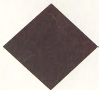
Mörkgrå metallic 214 Kommer