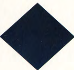
Mörkblå metallic 406 Kommer