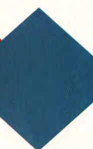
Mörkblå metallic 200 Utgår

Bränsleförbrukning: 0,88 (240 GL man.) - 1,07 l/mil (240 GLT 5-d. aut.) vid blandad körning. Kostnad 1500 mil 5.214-6.596:- (1/7 -86).