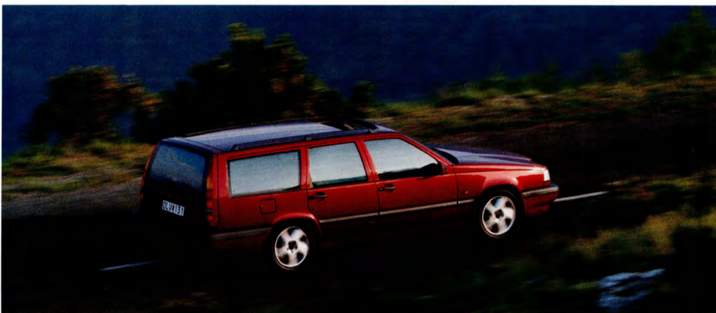
1993 kom herrgårdsvagnen. Här en Turbo -94.