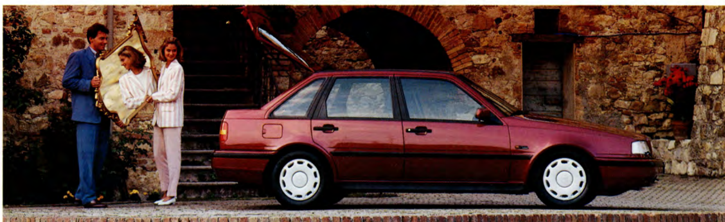
Volvo 440 GL med det nya utseendet och nya hjulcapslar.