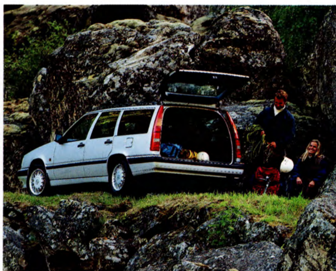
Volvo 850 GLT -94.