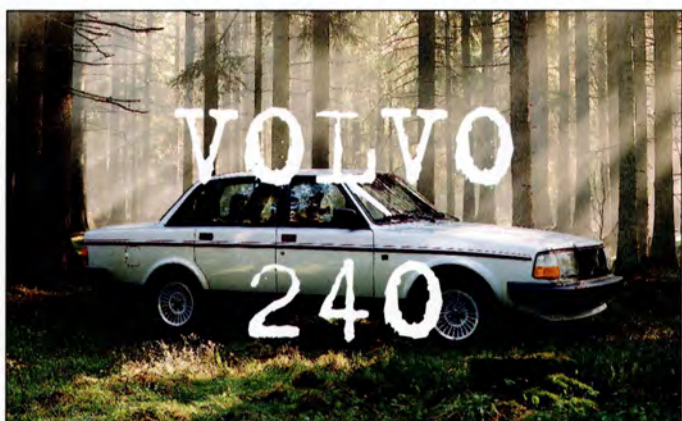
240 sid 16-17