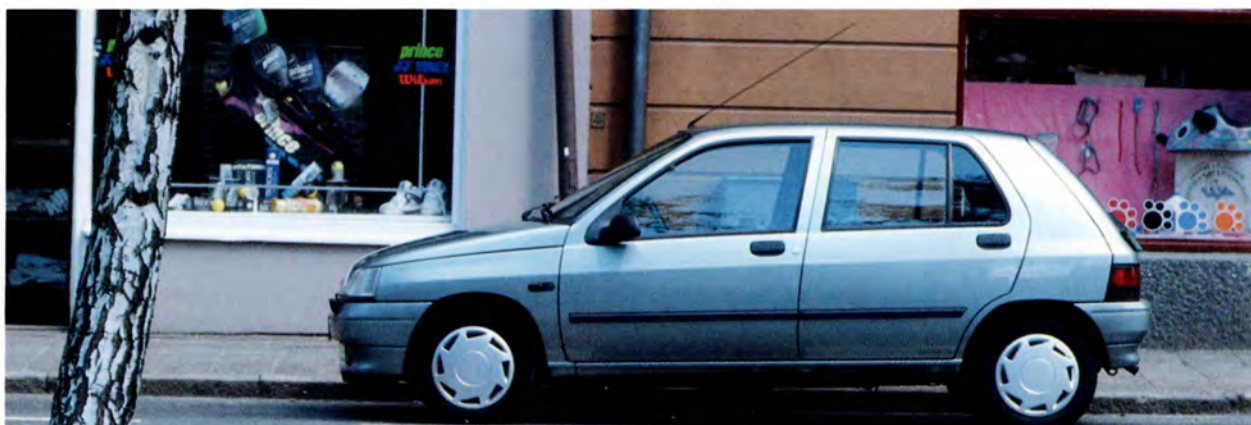
Renault Clio RT 93 års modell.

Nyheter 94: Bältesförsträckare, krockskydd i dörrarna, nya klädsel, ny instrumentpanel (RT) nya hjul, ny front och akter, nytt optionhjul, större ytterbackspeglar.