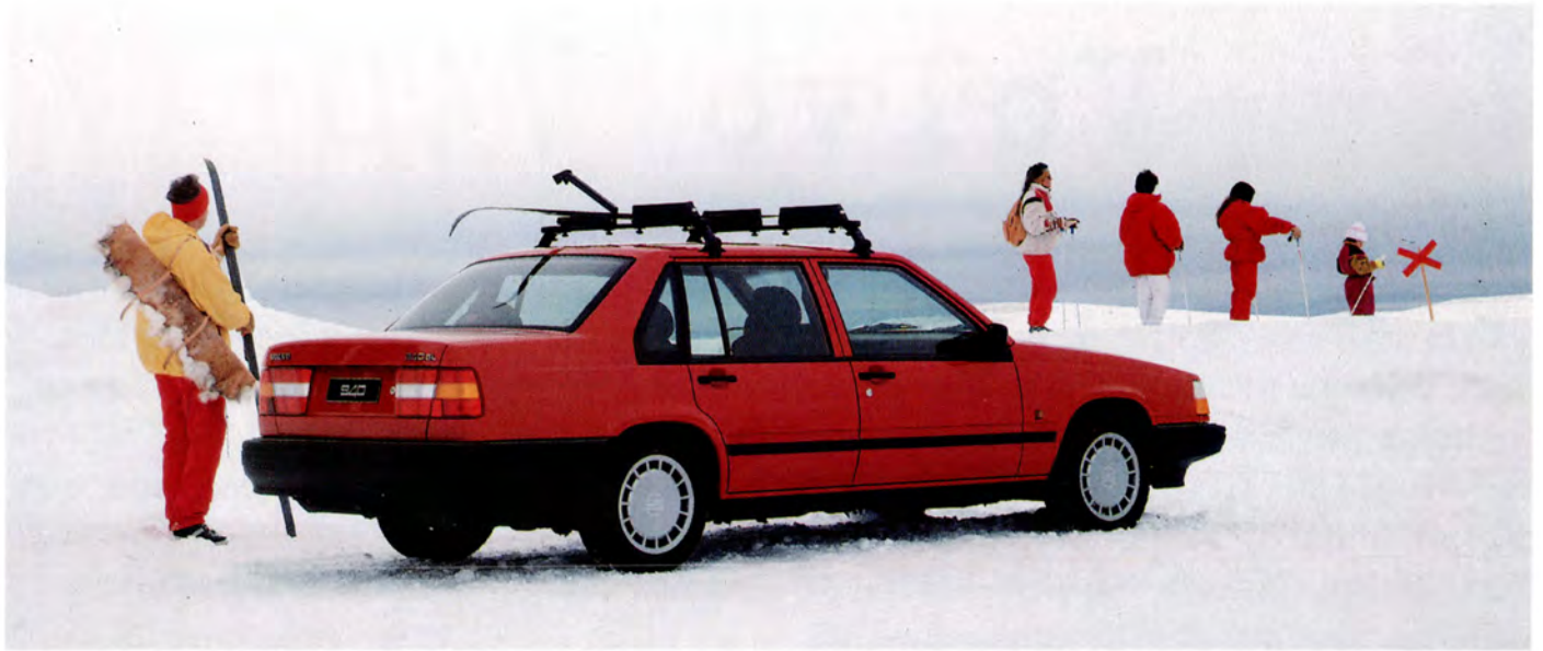
Volvo 940 GL 91 års modell, första årsmodellen.