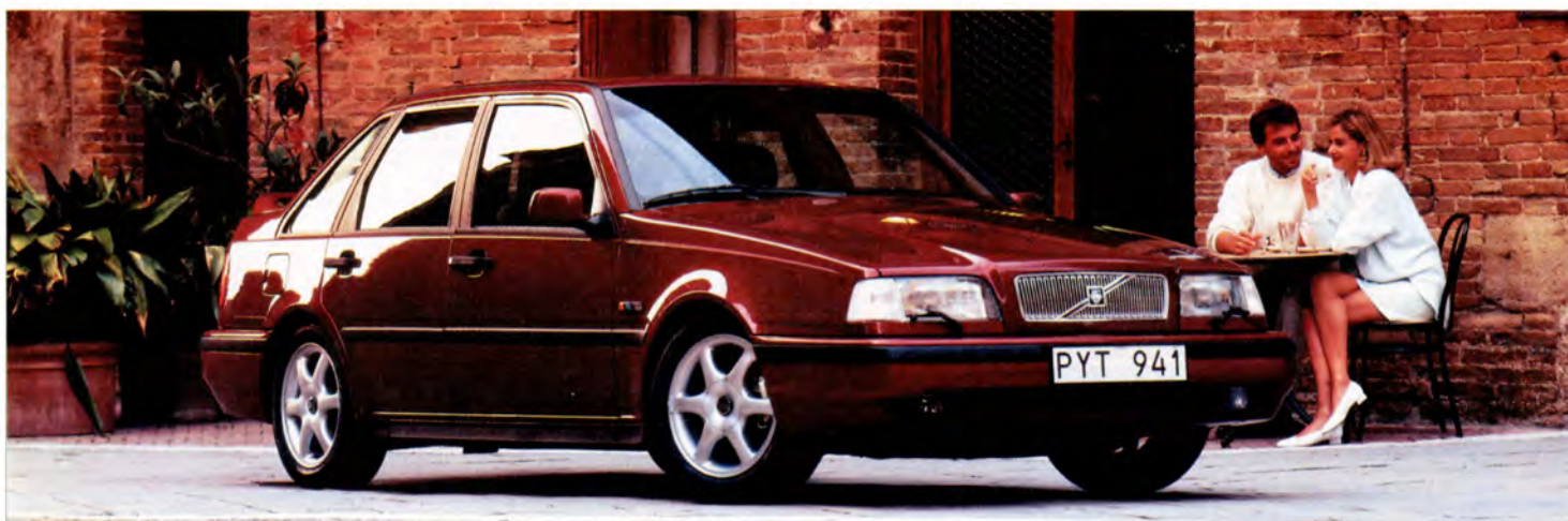
Variationer, tekniskt och utrustningsmässigt, kan förekomma.

Alla modeller (utom DL) fick samma år skivbromsar även bak samt nya fälgar/hjulsidor.