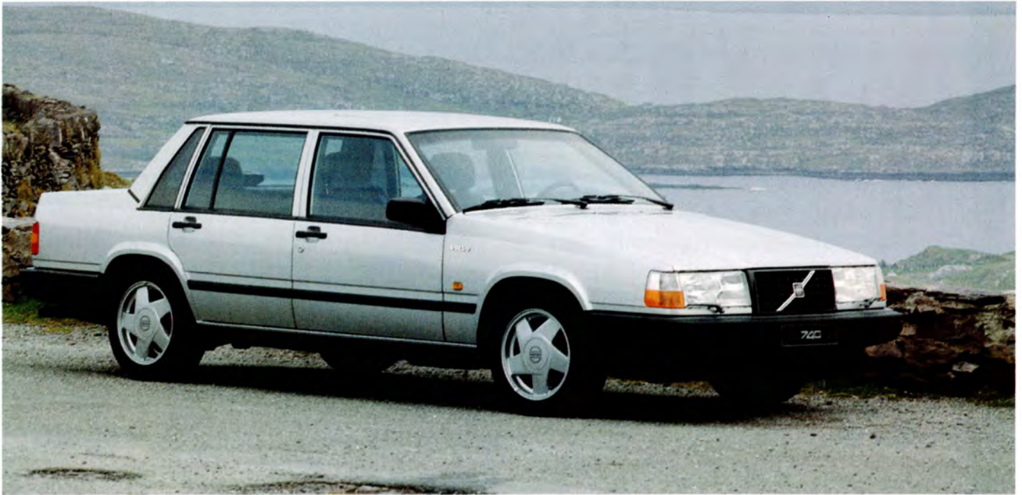
Volvo 740 Turbo 90 års modell.

Variationer, tekniskt och utrustningsmässigt, kan förekomma.