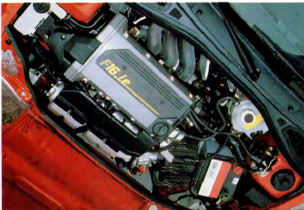
16 V-motorn kom 1992.

1993 års modeller fick en omfattande ansiktslyftning samt ny interiör. I samband med detta ändrade man modellbeteckningarna till RN (tidigare GTS) och RT (tidigare TXE). Beteckningen 16V fanns kvar. Nu försvann också namnet Chamade som beteckning på sedanmodellen.