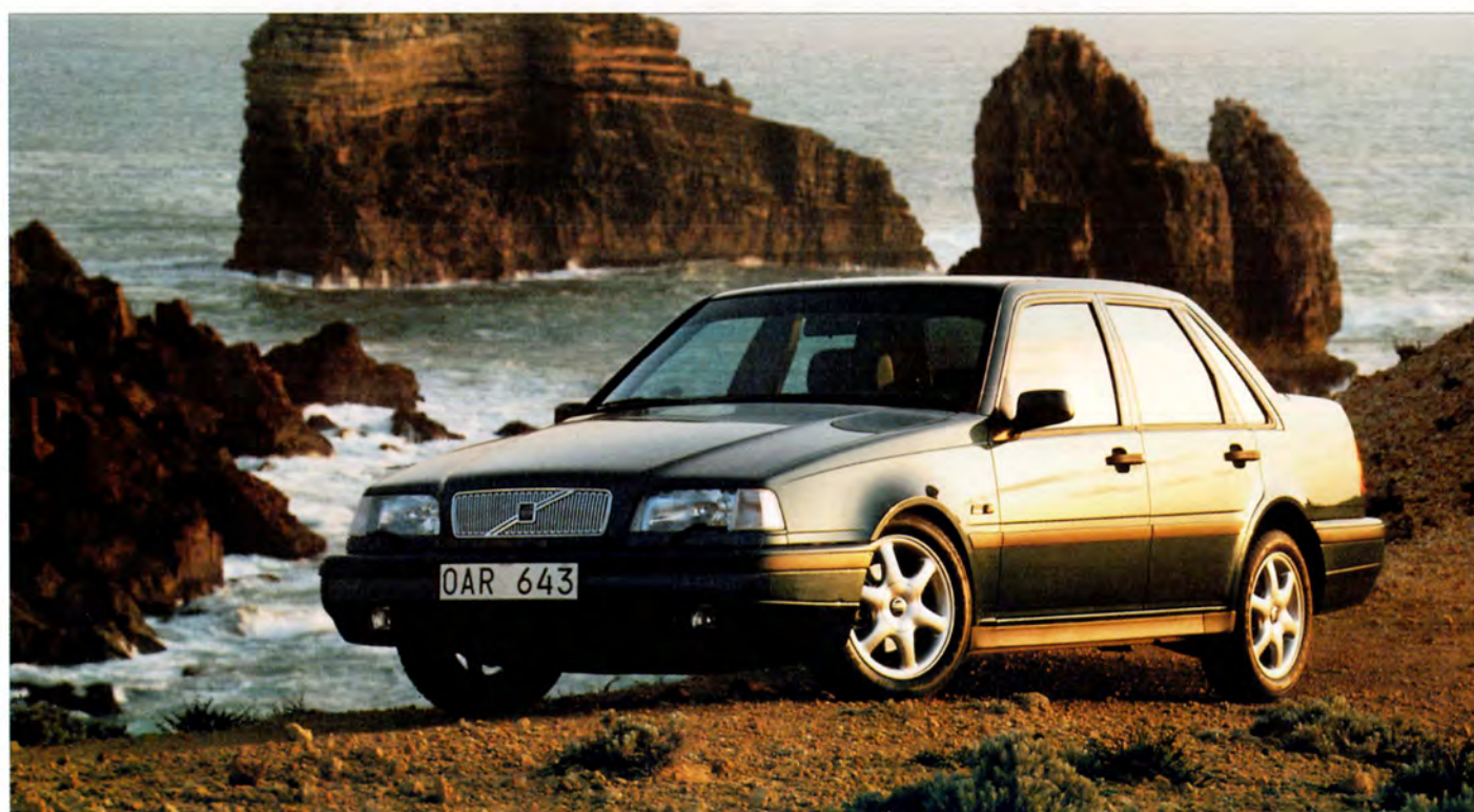
Volvo 460 Turbo 94 års modell.