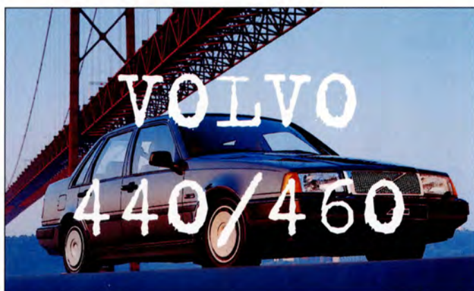
440 och 460 sid 18-21