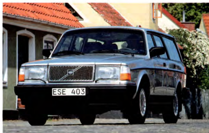
Volvo 240 GL Herrgårdsvagn 93 års modell.