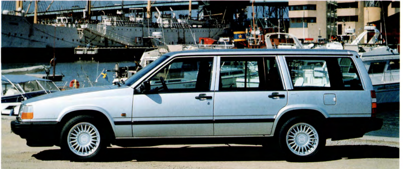
Volvo 940 Herrgårdsvagn med SE-paketutrustning.