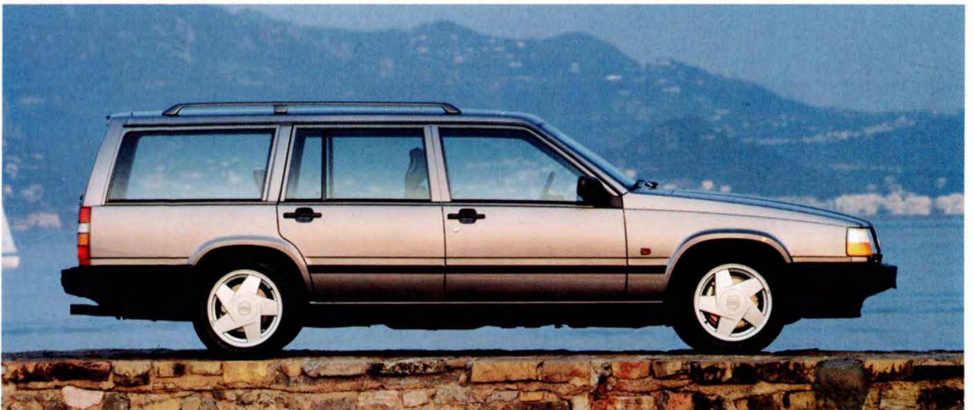
Volvo 940 Turbo Herrgårdsvagn 93 års modell.