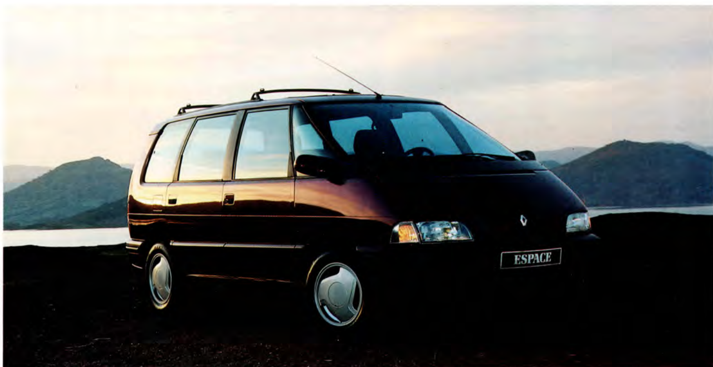
Renault Espace introducerades med 92 års modell.

Renault Espace kaross består av en självbärande stålbur, som är helt galvaniserad, vilket bidrar till de goda köregenskaperna. "Skalet" utanpå buren är tillverkat av kompositmaterial. Hela konstruktionen är mycket okänslig för rost.