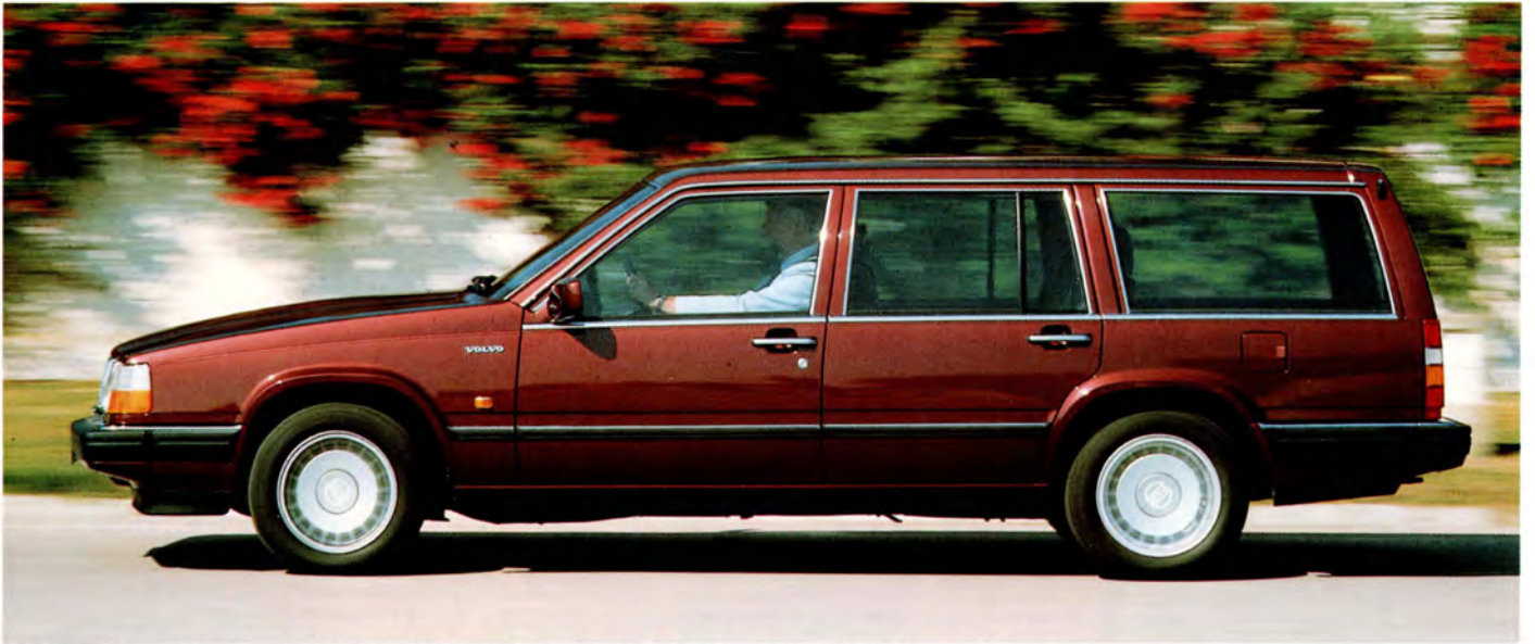
Volvo 760 finns som Herrgårdsvagn fr o m 86 års modell. På bilden en 88:a med den nya fronten.