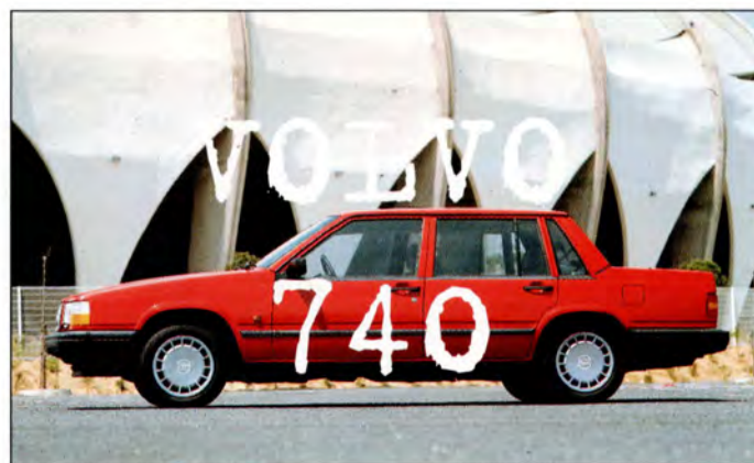
740 sid 14-15