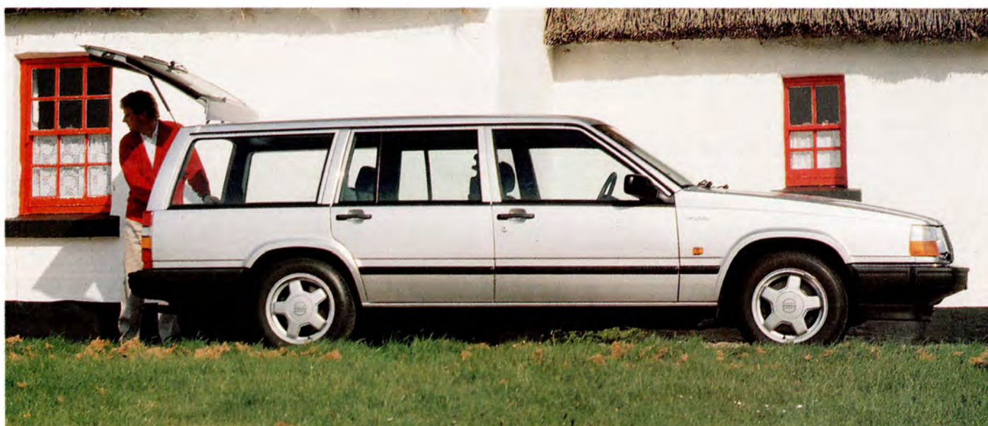
Volvo 740 GLT 16 Valve Herrgådsvagn 90 års modell.

Många 87:or, de flesta 88:or och fr o m 89 har alla 740 kat. motor. 1990 fick bilarna ny front och instrumentpanel.