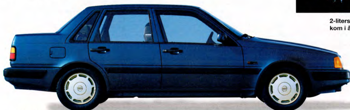
Volvo 460 Turbo 92 års modell.