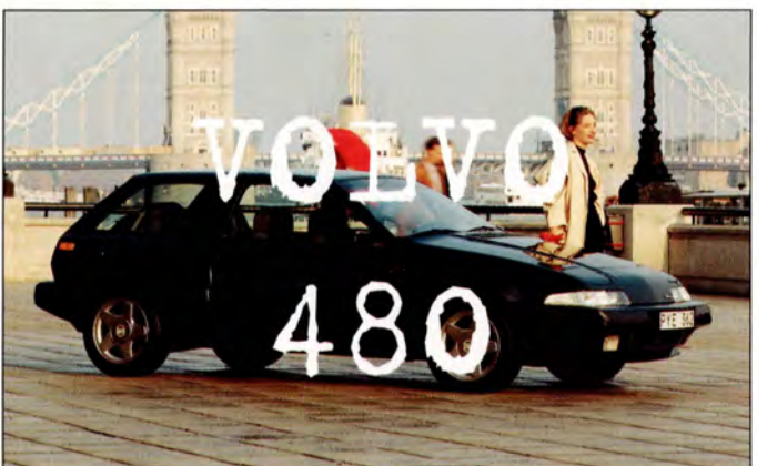
480 sid 22