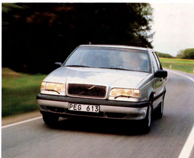
1994 kom Volvo 850 Turbo.