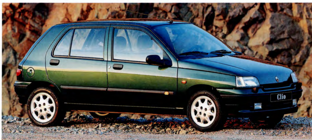
Renault Clio RT 94 årsmodell, "Nya Clio", extrautrustad med aluminiumfälgar "Gemini".