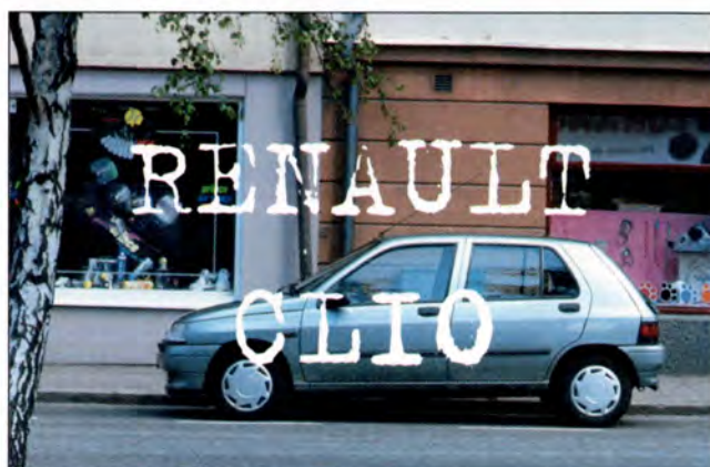
Renault Clio sid 28-29