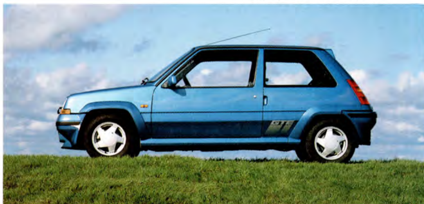
Renault 5 GTE 88 års modell.

Variationer, tekniskt och utrustningsmässigt, kan förekomma.