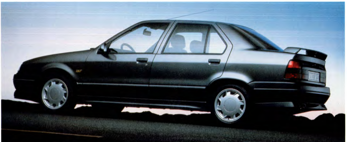
Renault 19 16V 92 års modell.