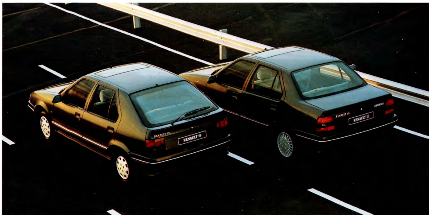
Renault 19 kombisedan och sedan (Chamade).

Variationer, tekniskt och utrustningsmässigt, kan förekomma.