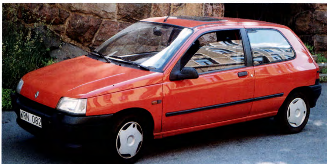
Renault Clio RN 91 års modell.