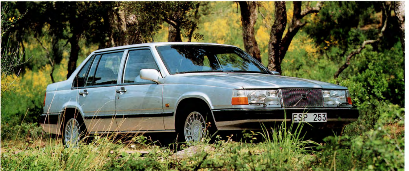
Volvo 960 93 års modell.