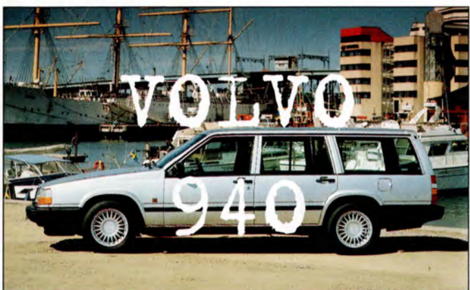
940 sid 12-13