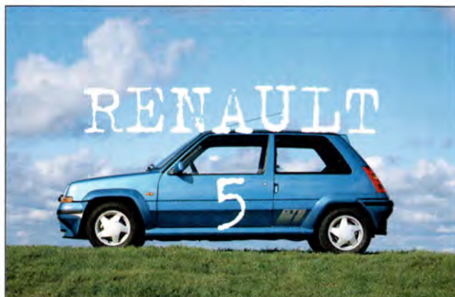
Renault 5 sid 30