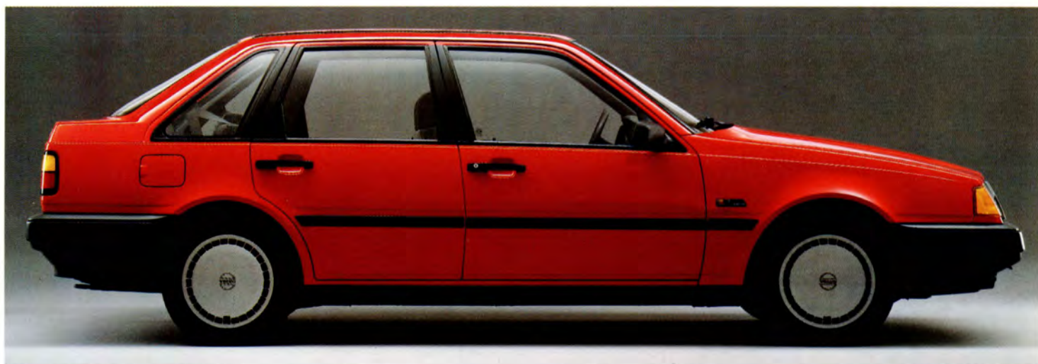
Volvo 440 GL 89 års modell.