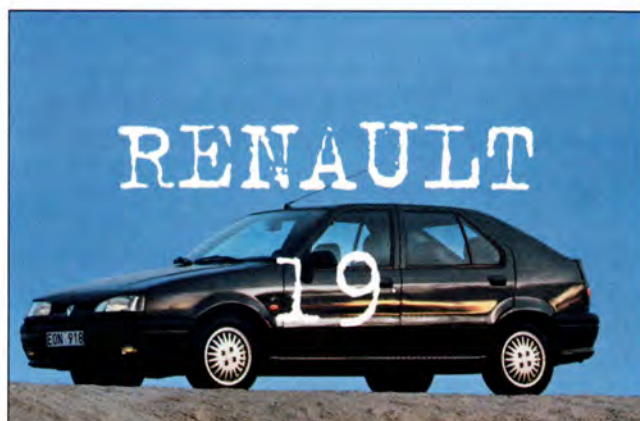
Renault 19 sid 26-27