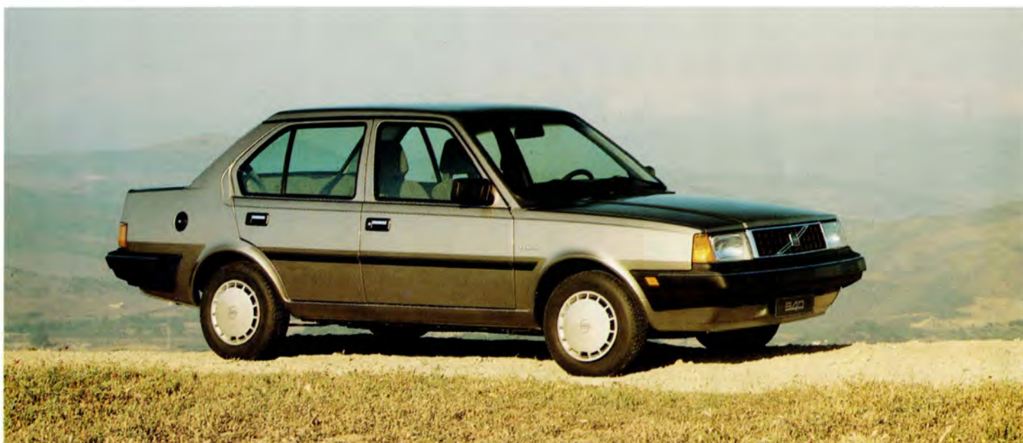
Volvo 340 GL 89 års modell.

Volvo 300-serien kännetecknas av mycket bra vägegenskaper, tack vare den avancerade konstruktionen med växellådan monterad vid bakaxeln. Det ger denna bakhjulsdrivna bil en bra vikt-fördelning mellan fram- och bakvagn.