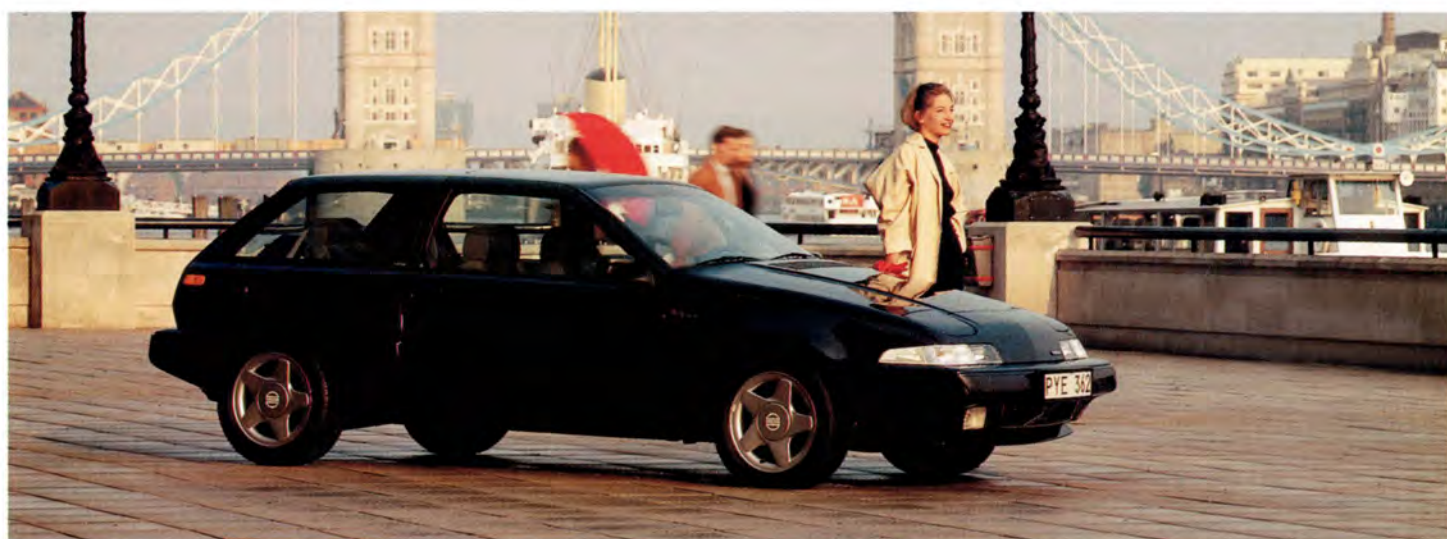
Volvo 480 Turbo av 94 års modell.

Sedan årsmodell 1988 kan man få Volvo 480 i både ES- och Turbo-version. Fr o m 1993 års modell har ES en mycket trevlig 2-litersmotor.