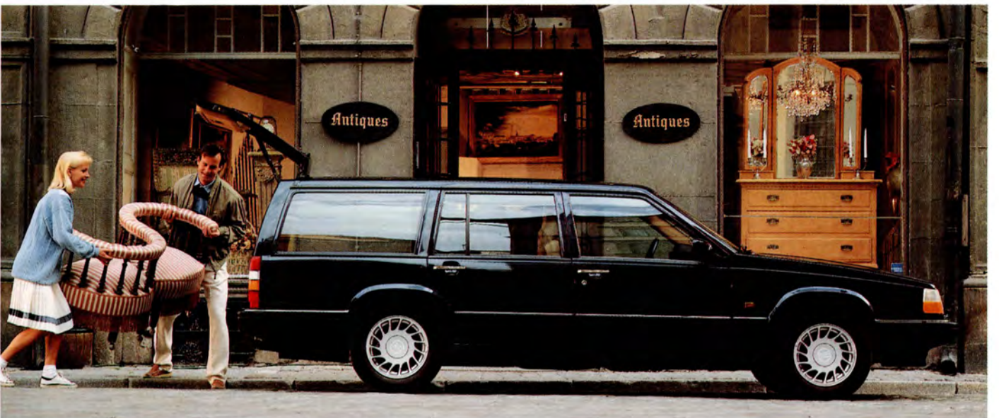
Volvo 960 Herrgårdsvagn 93 års modell.