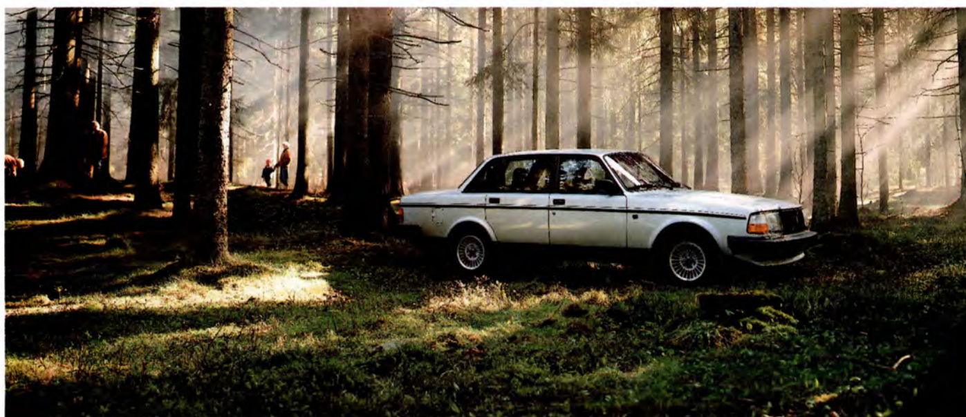
91 års Volvo 240 GLT med bl a aluminiumfälgar.

Sista årsmodellen för Volvo 240 är 1993 (sista produktionsdag var 7 maj). Har du tur kanske du kan finna ett av de sista 240 numrerade exemplaren!