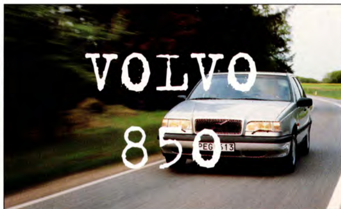
850 sid 10-11