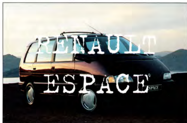
Renault Espace sid 25

Med Volvokortet får du, förutom lägre bensinkostnader och förmånliga erbjudanden, även bättre betalningsvillkor. Närhet till service och reparationer får du tack vare Sveriges största stationsnät.