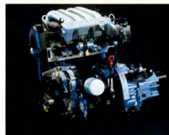
2-liters motorn som kom i årsmodell 93.

För dem som värdesätter en något mindre bil, men ändå vill få tillgång till Volvos erkänt höga säkerhetsnivå, är Volvo 440/460 ett givet val.