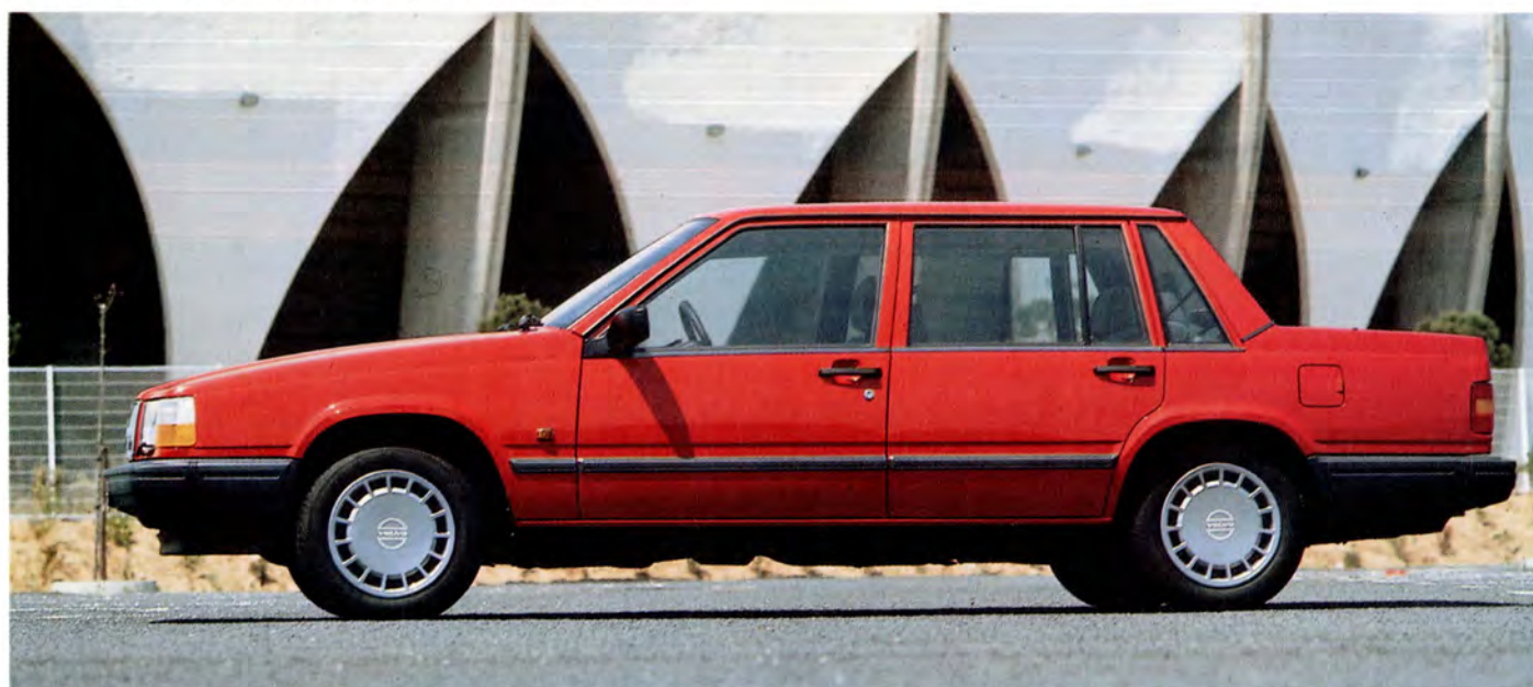
Volvo 740 GL 91 års modell.