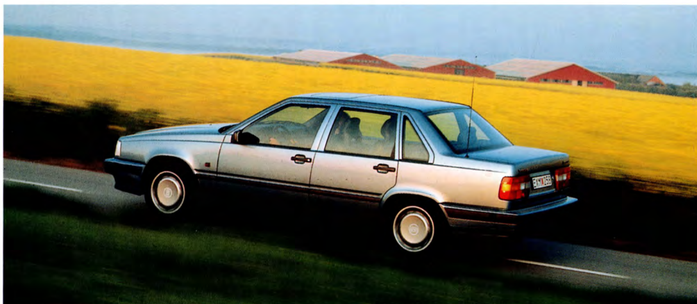
Volvo 850 GLE 93 års modell.