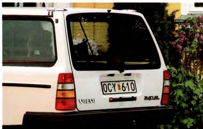
Herrgårdsvagnen fick ny baklucka med större ruta på 90 års modell.