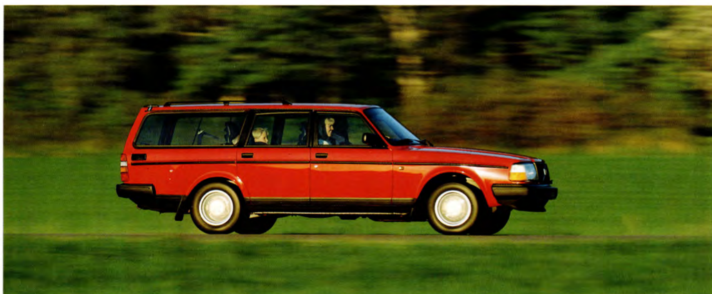
En 91:a med GLT-paket som bl a innehåller ABS-bromsar.

Variationer, tekniskt och utrustningsmässigt, kan förekomma.