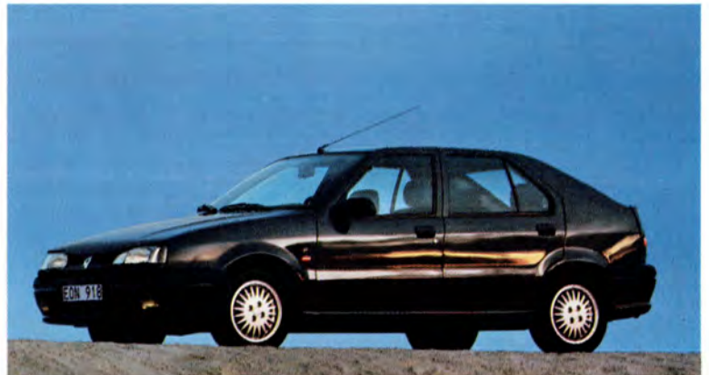
Renault 19 RT 93 års modell.