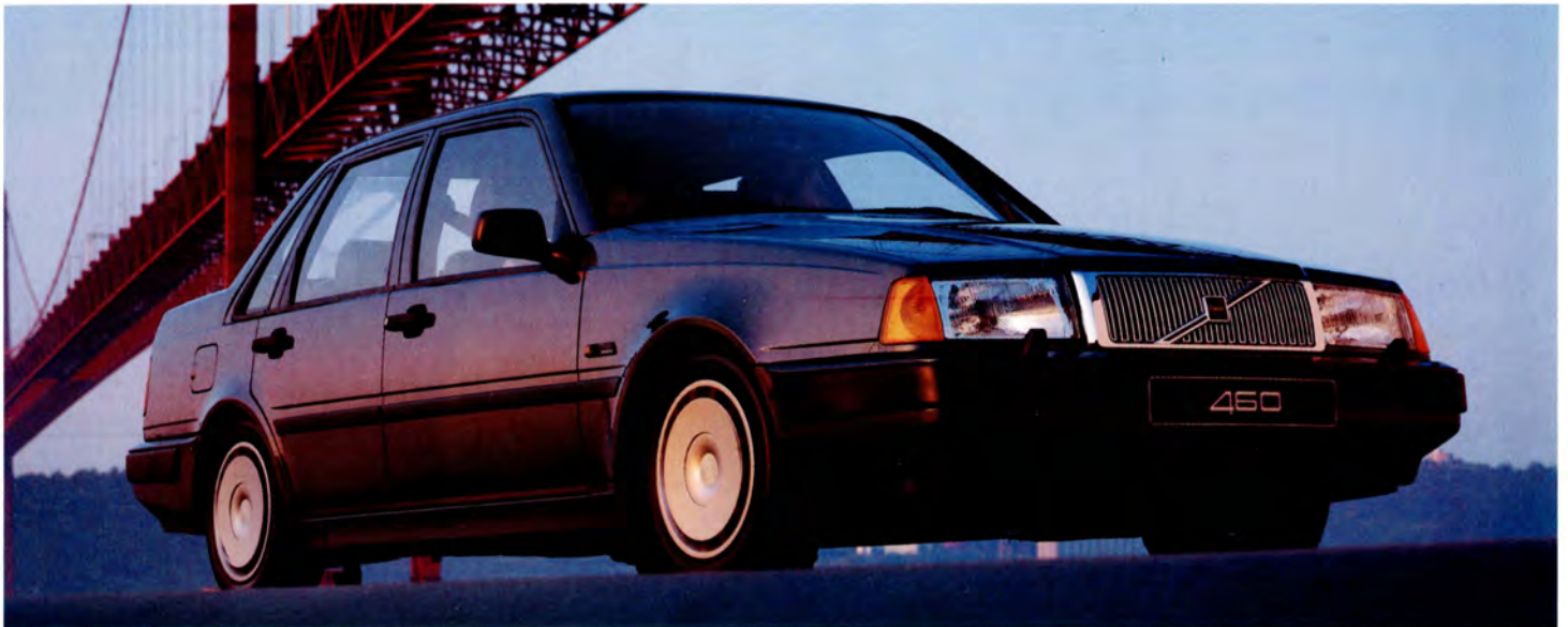
Volvo 460 GL 92 års modell.

Variationer, tekniskt och utrustningsmässigt, kan förekomma.