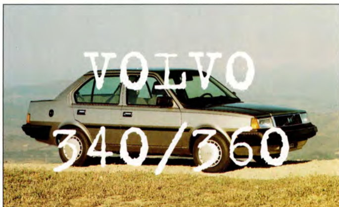
340 och 360 sid 23