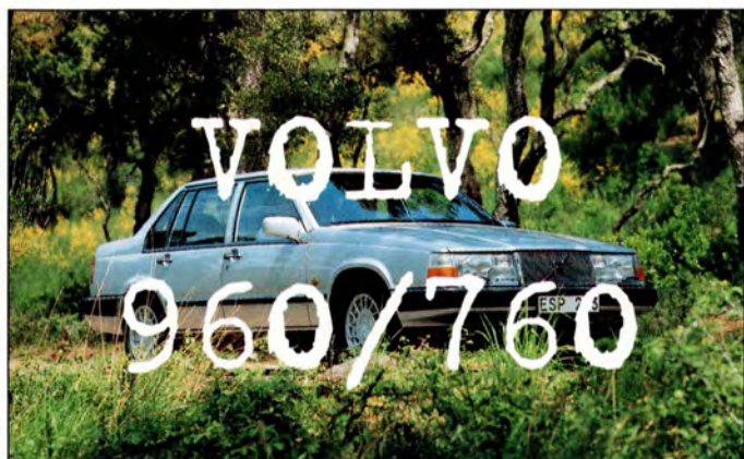
960 och 760 sid 8-9