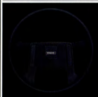
Vänddiameter som en småbil, 9,2 meter.