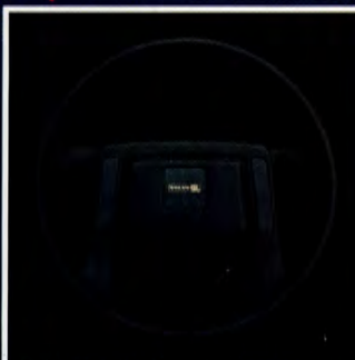
Mjuk, lättgående servostyrning.