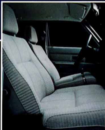
Ljusgrå tygklädsel. Nackskyddskuddar.