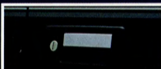
Elegant silvergrå dekorstripes runt om.