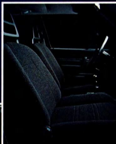
Snygg, helsvart tygklädsel. Tonade rutor.