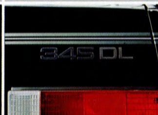
Bränsledeklaration Volvo 345 DL: 0,88 l/mil, blandad körning.