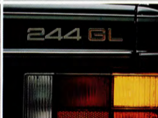
Bränsledeklaration Volvo 244 GL: 1.0 l/mil, blandad körning.