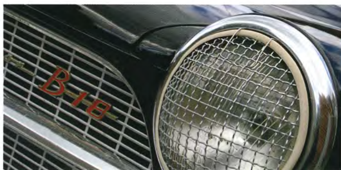
Stenskottsskydd för framljusen var extratillbehör för Amazon och bra att ha på grusvägar.

– Det får gärna vara lite patina på dem, som gulnad plast och lite spruckna lister. Jag är emot sådana där topprenoverade bilar som ser helt nya ut. Ny lack, nytt skrov, ny klädsel, nymålade motor